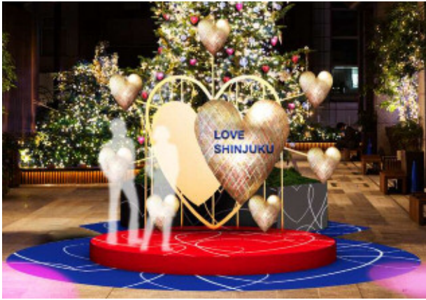
タカシマヤ タイムズスクエア ※画像はイメージです。

新宿サザンテラスでは、ビッグフラワーが咲き誇る「ビッグフラワーパーク」を実施いたします。大きな花の中に座ってカラフルな周囲の花々に囲まれながら、写真をお撮りいただけます。タカシマヤ タイムズスクエアでは、「Heartシリーズ」を製作し続けるアーティスト・西村公一氏監修の“ハート”をモチーフにしたオブジェが登場いたします。Suicaのペンギン広場では、シャンデリアで飾ったSuicaのペンギン像や、リングの重なりをイメージしたシンボルトリーなど、SNS映えするスポットをお楽しみいただけます。