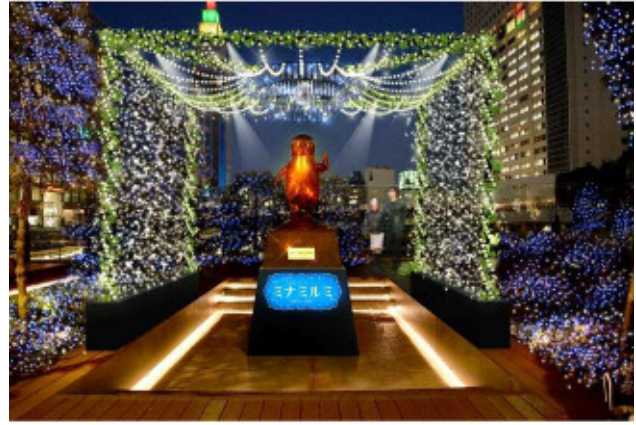
Suica のペンギン広場 ※画像はイメージです。