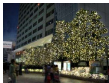
新宿サザンテラス